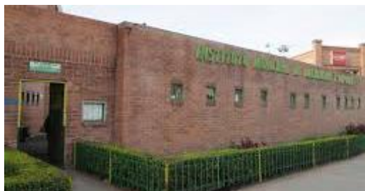
Fotografía 3. Con buenas prácticas administrativas el IMRD le apunta a ejecutar procesos de transparencia

El Instituto Municipal de Recreación y Deporte de Chía, como entidad del estado y en cumplimiento de la normatividad vigente, avanza a pasos agigantados en la correcta evaluación y control del Modelo Integrado de Planeación y Gestión-MIPG, a través de la Dimensión 7 que la Oficina de Control Interno lidera.