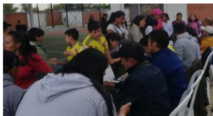
Fotografía 1. Con 700 inscritos en las escuelas descentralizadas, el IMRD confirma esta iniciativa del Alcalde

Uno de los principales objetivos del alcalde Luis Carlos Segura, es la descentralización de las escuelas de formación deportiva del Instituto Municipal de Recreación y Deporte, con miras a garantizar una mayor cobertura a todos los niños y jóvenes del municipio, teniendo en cuenta que se ofrecerán nuevas disciplinas deportivas para pasar de 24 a 32.