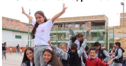
Fotografía 2. Porrimo es otra de las escuelas de formación que hizo parte de la primera prueba piloto realizada por el IMRD.

El Instituto Municipal de Recreación y Deporte realizó la “Feria de Servicios” en la IEO Laura Vicuña, como parte del plan piloto para la implementación de la jornada complementaria en los colegios de Chía.